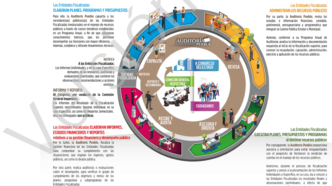
Diagrama 1 Proceso de Fiscalización Superior 2017